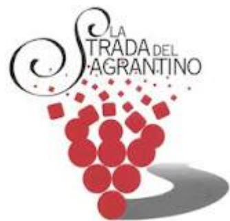
I valori sociali, simbolici ed economici legati alle produzioni di qualità (Il Sagrantino di Montefalco - http://www.abbuffone.it/archives/29 )

Si tratta di una caratterizzazione sintetica che restituisce le risorse sociali-simboliche a partire dai valori estetici simbolici e sociali che assumono spesso anche valore economico.