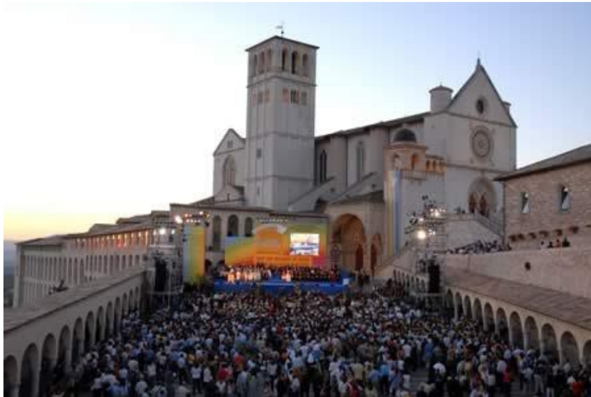
I valori sociali e religiosi di Assisi

In questo senso, a partire dalle conoscenze maturate, vengono sintetizzate quelle risorse riconducibili ai luoghi simbolici e di significato, sia per valori storico-culturali, che testimoniali, delle tradizioni locali, culturali e religiosi; quei sistemi naturalistici significativi, oltre che per i valori ambientali ed ecologici anche per il significato simbolico e di riconoscimento che gli vengono attribuiti dalle popolazioni locali e sovra locali; quei luoghi che rappresentano i principali presidi delle produzioni agricole di qualità, rappresentative anche di una tradizione locale, che assumono anche un valore economico oltre che culturale.