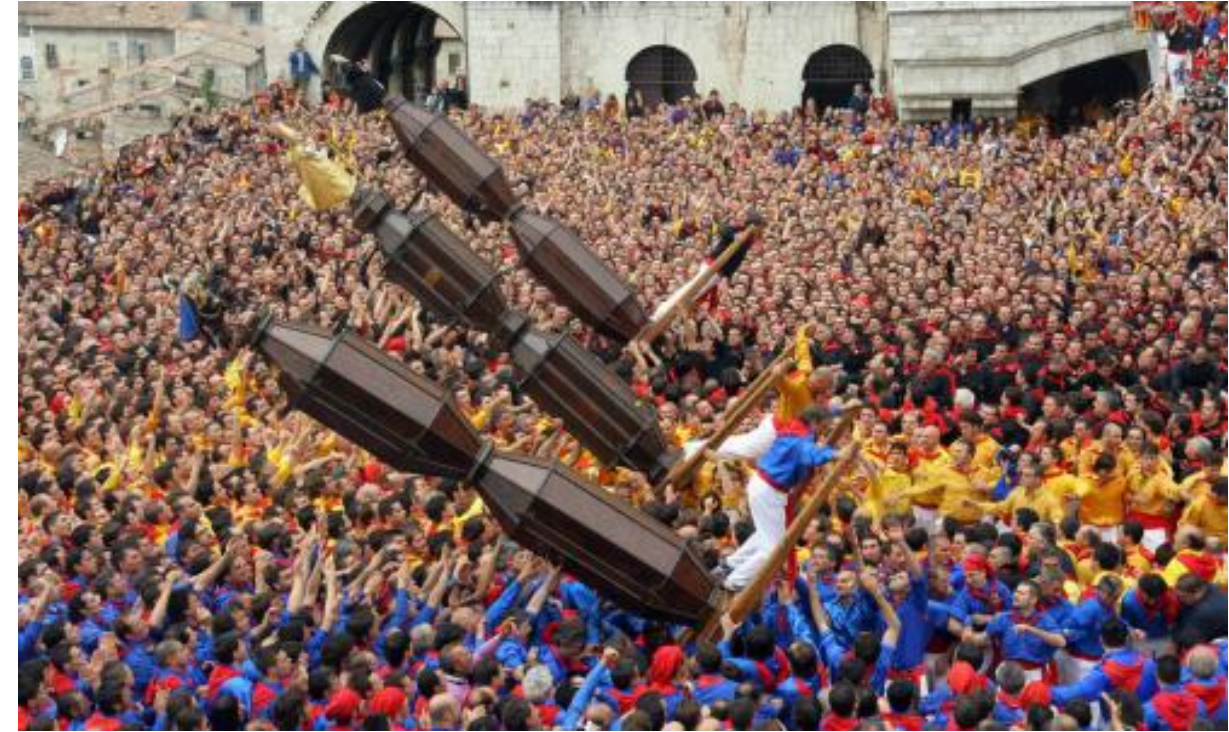
I valori sociali e simbolici di Gubbio – La festa dei Ceri