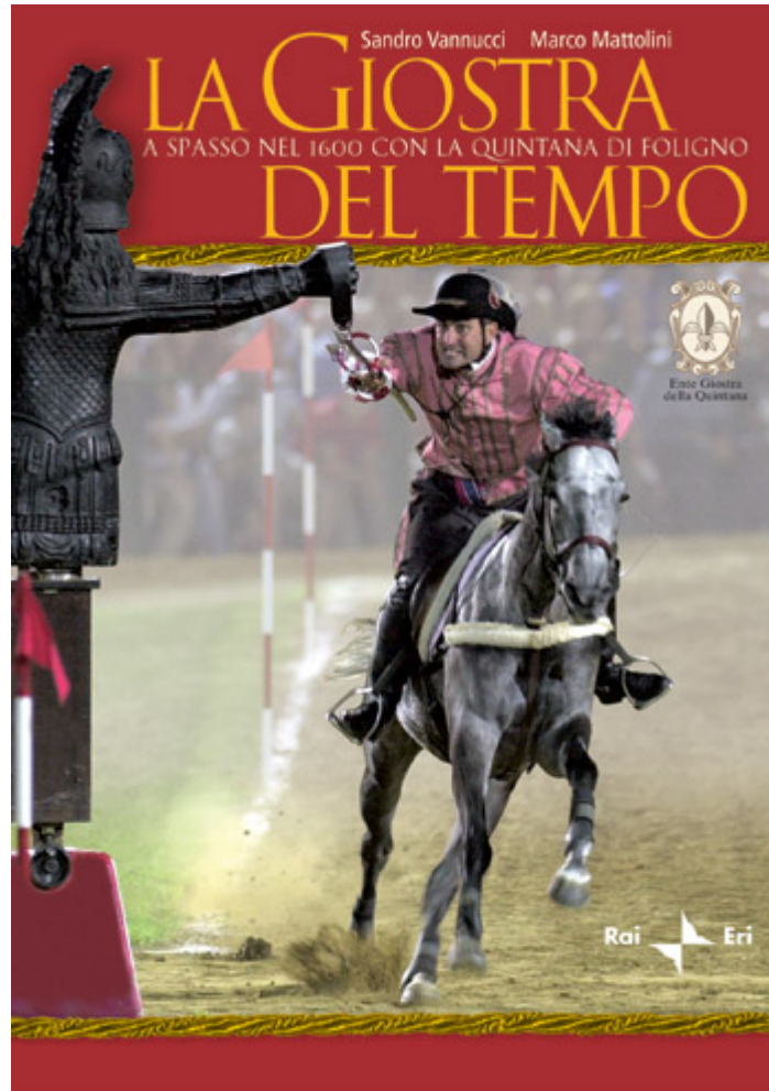
I valori sociali e simbolici di Foligno – La giostra della Quintana ( http://www.eri.rai.it/internaLibro.aspx?idlibro=656 )