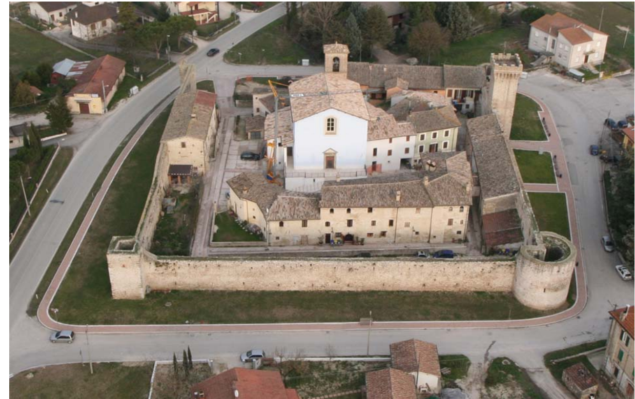
Castel San Giovanni – Comune di Castel Ritaldi