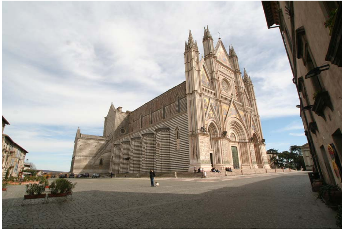
Il Duomo di Orvieto