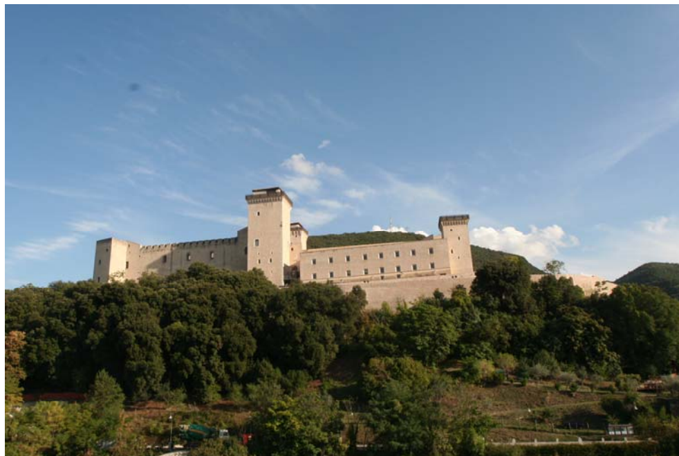
La Rocca di albornoziana di Spoleto