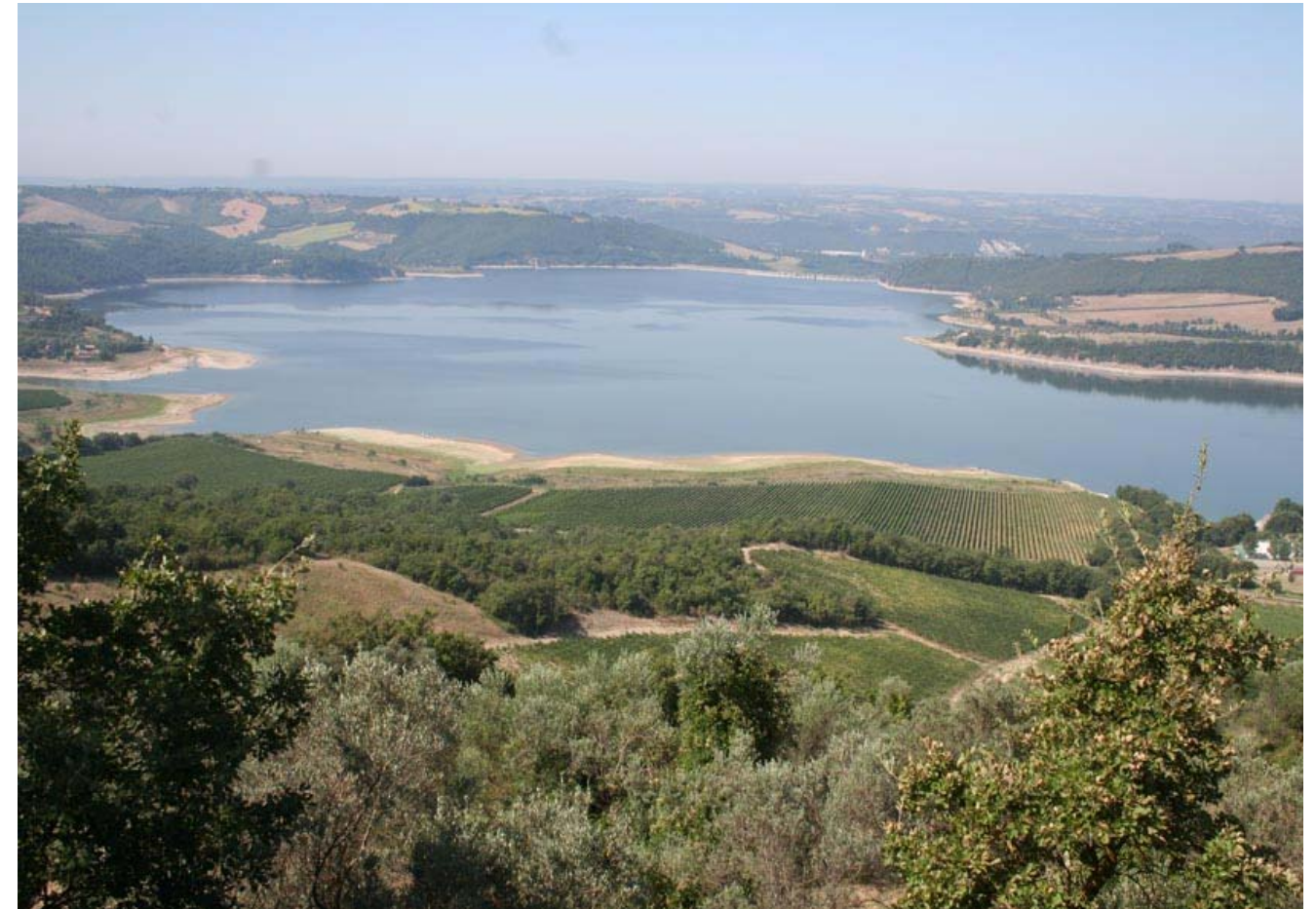
Il Lago di Corbara