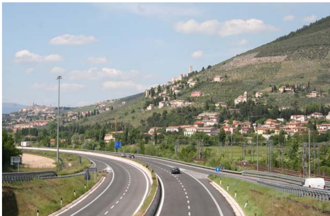
Le infrastrutture viarie tra Pissignano e Trevi

Si tratta di una caratterizzazione sintetica che ricompona le conoscenze di carattere fisico e naturalistico sottoforma di risorse paesaggistiche, rimandando evidentemente agli opportuni approfondimenti e dettagli ad ogni singolo tematismo, desumibile dal repertorio delle conoscenze o dagli studi settoriali specialistici, grazie ai quali è stato possibile restituire in forma sintetica il patrimonio di risorse paesaggistiche in oggetto.