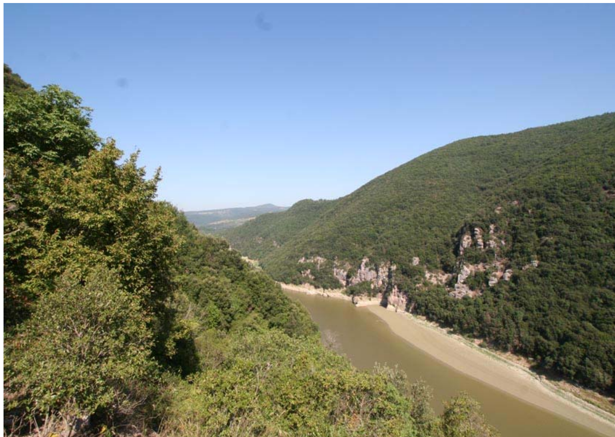
Le Gole del Forello

A partire da questa impostazione la cartografia restituisce i caratteri paesaggistici di tipo fisico, come le aree urbanizzate e l'apparato infrastrutturale, la struttura morfologica del territorio, e di tipo naturalistico-ambientale, come la rete idrografica principale, la copertura forestale, i siti di naturalità, come la Rete natura 2000 e i Parchi.