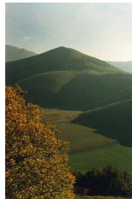
La catena dei Sibillini